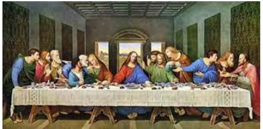
La Cène , Léonard de Vinci (XV e s.)