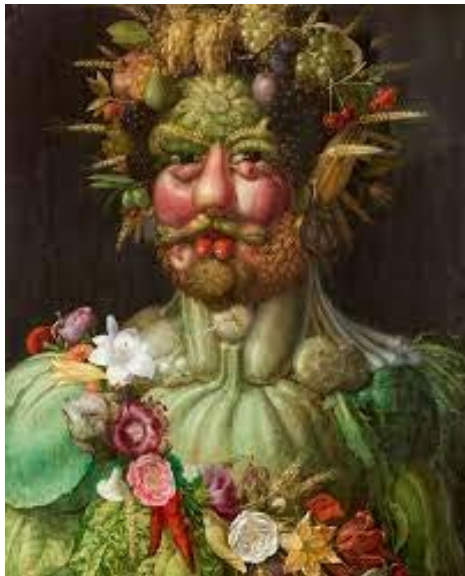
Vertumne , Arcimboldo (XVI e s.)