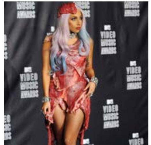
Lady Gaga et sa robe de viande

https://www.herodote.net/Roi_des_cuisiniers_cuisinier_des_Rois-synthese-598.php