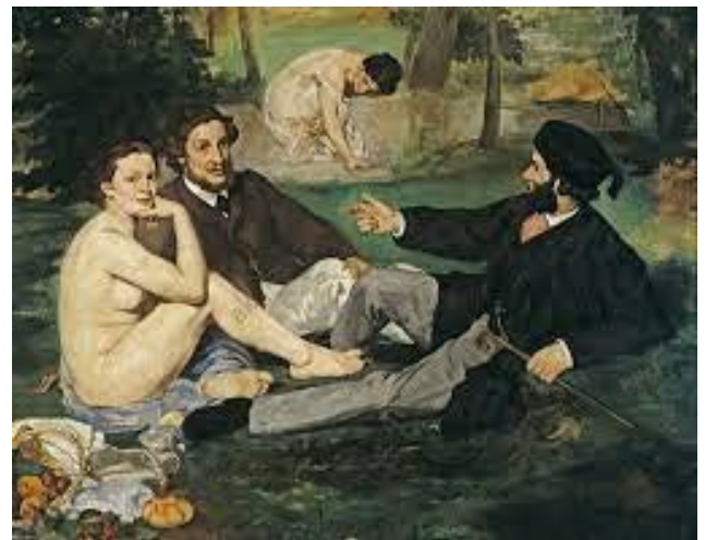
Déjeuner sur l'herbe , Monet (XIX e s.)