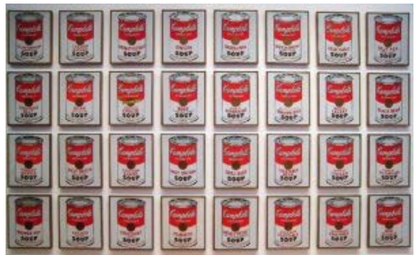
Campbell's soup , Andy Warhol (XX e s.)