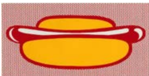
Hot Dog , Lichtenstein (XX e s.)