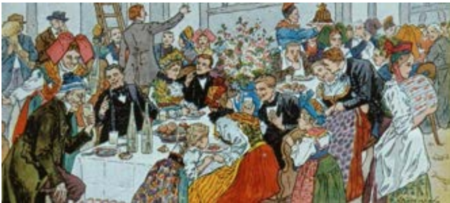
Paul Kaufmann, Le repas de noce, 1902 (BNUS)

A contrario : La petite mort du repas à table (Slate, 2017), D'où vient notre attirance pour la malbouffe ? (Sciences et Avenir, 2019)